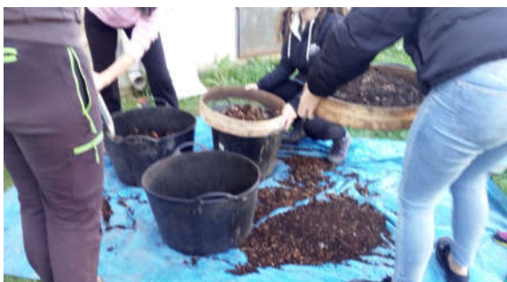
Las chicas de Zubiri, entre cedazos y palas cribando compost. Para cuando nos dimos cuenta la faena ya estaba hecha.

Las cinco personas que acudieron el 13 de febrero al encuentro (todas ellas mujeres) extrajeron una cantidad aproximadamente de 500L que fueron cribados para emplearlo en jardines, tiestos y huertas. Para premiar el esfuerzo de esta primera extracción Mancomunidad obsequió a las asistentes, con una planta de flor de temporada.