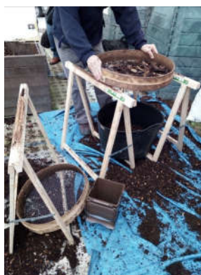
Sistema de criba con caballete

uno . La cantidad extraída fue aproximadamente de 3500L de compost, que se repartieron entre el personal asistente.