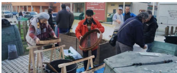
Diferentes participantes en San Jorge cribando el material

En torno a unas 30 personas (propias del área y venidas de huerta y otras áreas) acudieron a la cita y entre todas se vaciaron 4 compostadores de 1050L cada uno .